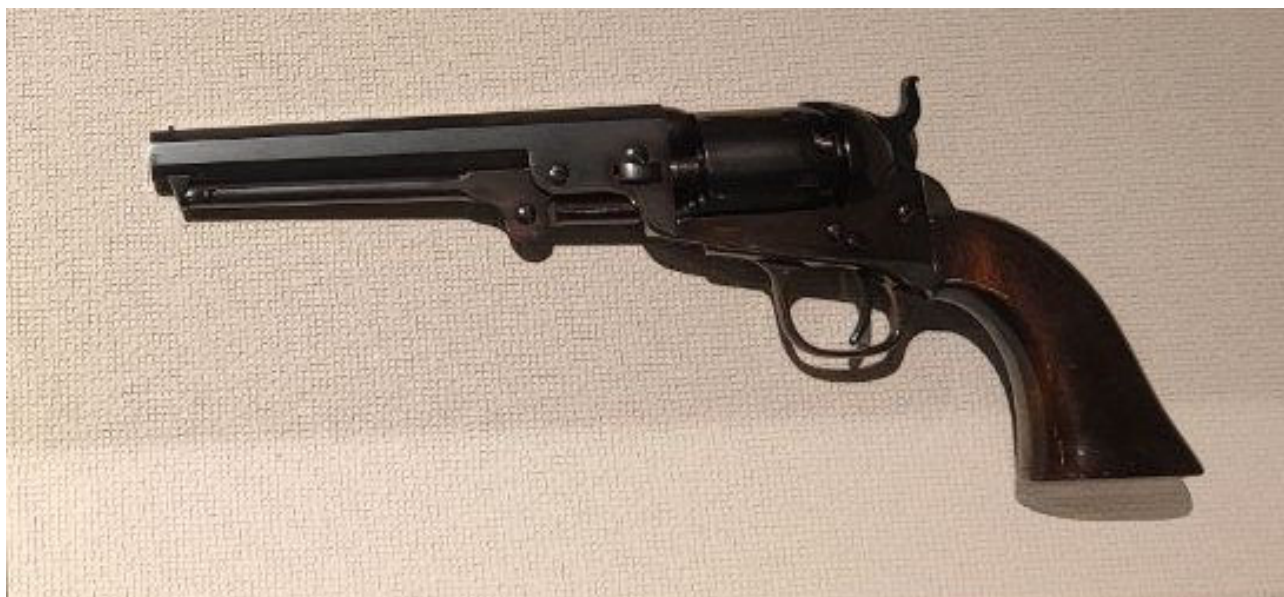
Илл. 10. Револьвер Colt 1851 Navy из коллекции музея г. Хакодате.

В 1860 г. при убийстве видного политического деятеля Японии того периода Ии Наосукэ (1815–1860) была использована японская копия Colt 1851 Navy 19 , а револьвер Smith & Wesson Mod. 2 был личным оружием самурая Сакамото Рё:ма, которым он отстреливался во время покушения в 1866 г.