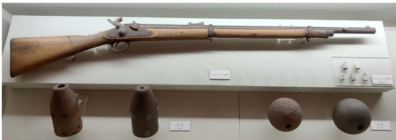
Илл. 4. Винтовка P1853 Enfield из коллекции музея г. Хакодате.

Помимо прочего, в Японии было налажено собственное производство подобных мушкетов, в том числе в традиционных оружейных районах, таких как Сакай [Nagakura 2018: 14–15]. Однако сёгунат достаточно быстро отказался от идеи производить своё оружие. В 1862 г. в Японию начали массово проникать ружья нового типа. Их стали именовать по типу пули, которую они использовали – «ружья Минье». Они поступали в Японию из Великобритании, США, Нидерландов, Бельгии, Франции, Австрии.