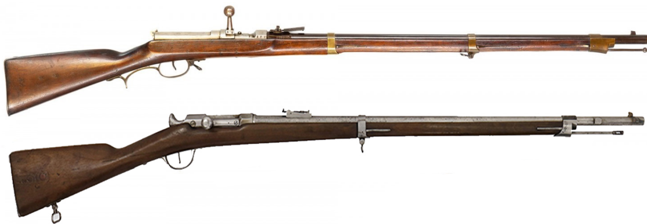
Илл. 7. Немецкая винтовка Дрейзе 1840 г. и французская винтовка Шасспо 1866 г.

Игольчатые системы импортировались на самом закате эпохи Токугава и по своим характеристикам превосходили конкурентов, однако мало использовались непосредственно в гражданской войне Босин 1868–1869 гг. из-за сложностей с обслуживанием и нехватки специализированных боеприпасов.