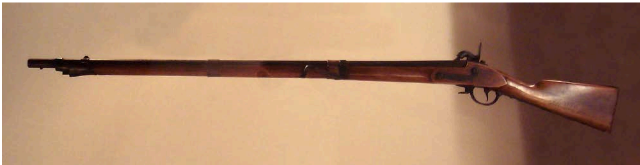
Илл. 2. Мушкет Bavarian Model 1842, типичный представитель класса «Гевер».