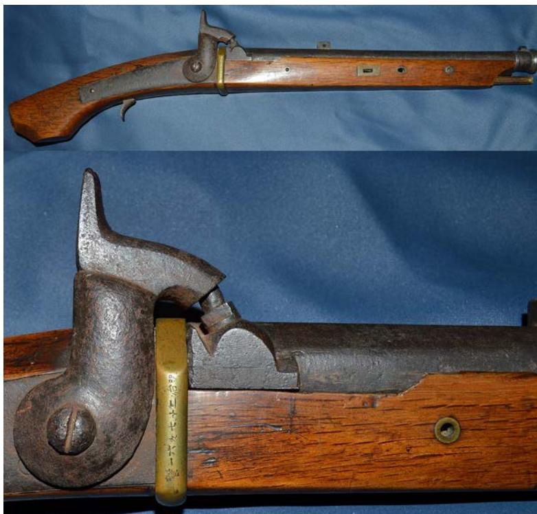
Илл. 3. Один из многочисленных примеров переделки японского фитильного огнестрельного оружия в капсюльное

Были также и случаи переделки фитильных ружей в кремневые и капсюльные уже в Японии. Существовал симбиоз японского фитильного оружия и капсюльного замка (ドンドン銃, дондору-дзю: ).