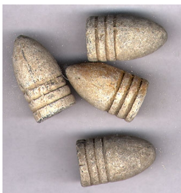
Илл. 5. Остроконечная пуля Минье