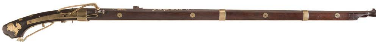
Илл. 1. Аркебуза «Танэгасима» периода Эдо (1600–1868).