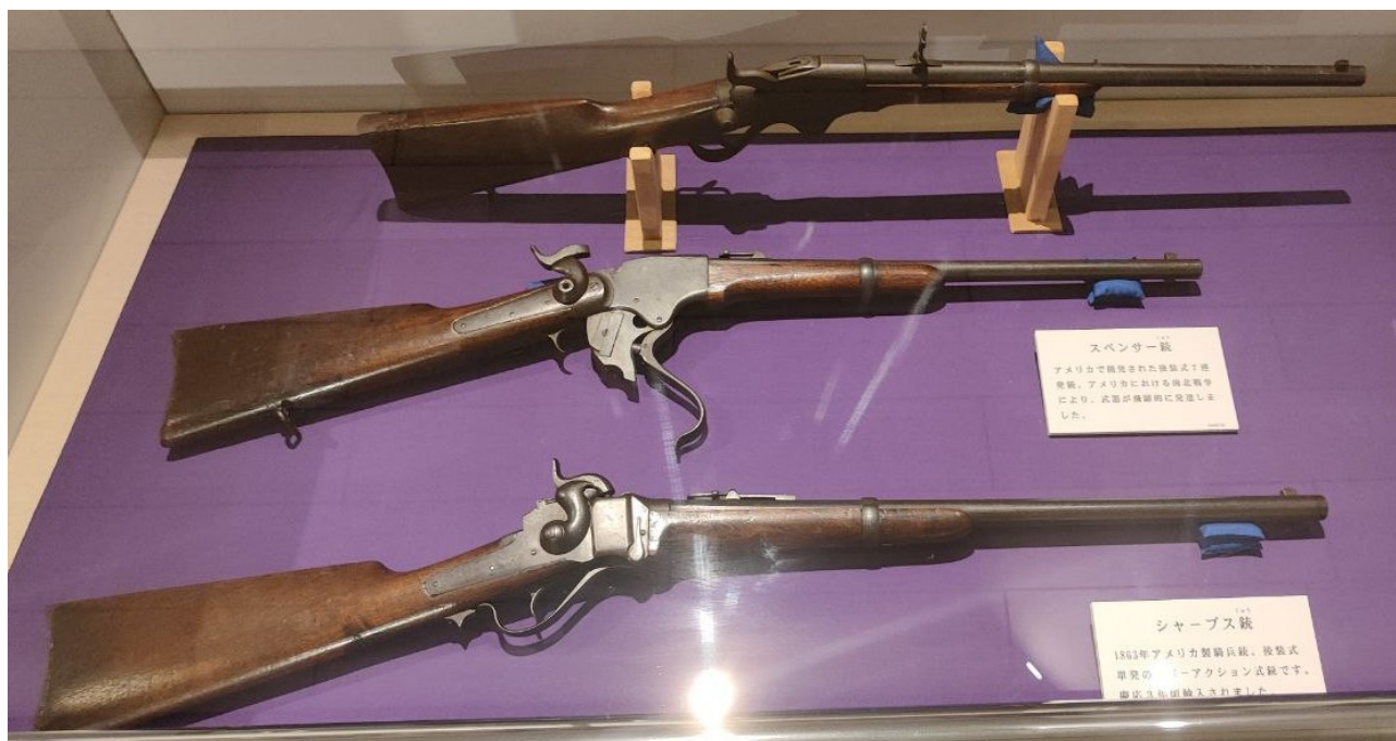
Илл. 6. Карабины Спенсера и Шарпса из коллекции музея г. Хакодате.