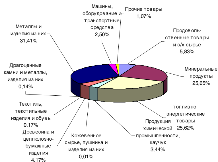
Рис. 2. Структура экспорта России в РК в 2006 г.

Соответственно, серьезного увеличения масштабов российского экспорта в РК можно добиться только за счет расширения номенклатуры вывозимых товаров. И это проблема не столько российско-южнокорейской торговли, сколько российской внешнеторговой стратегии в целом. Последние тенденции в экономике РФ, связанные с экспансией государства в энергетический сектор, созданием национальных компаний мирового уровня в других ключевых отраслях хозяйства, попыткой (впервые за многие годы) реализации новой промышленной политики в рамках приоритетных национальных проектов, использованием для модернизации и реструктуризации индустрии частно-государственного партнерства – все это неизбежно должно привести к государственной поддержке конкурентоспособности российской продукции на мировых рынках. Первый шаг в этом направлении уже сделан: еще летом 2006 г. Министерство экономического развития и торговли РФ предложило создать национальное агентство по поддержке экспорта 13 . Продолжения пока не последовало, и сейчас самое время для научной общественности, связанной с экономикой, поддержать и инициировать конкретные действия в данном направлении. В проекции на Корею здесь следует выделить три актуальные проблемы.