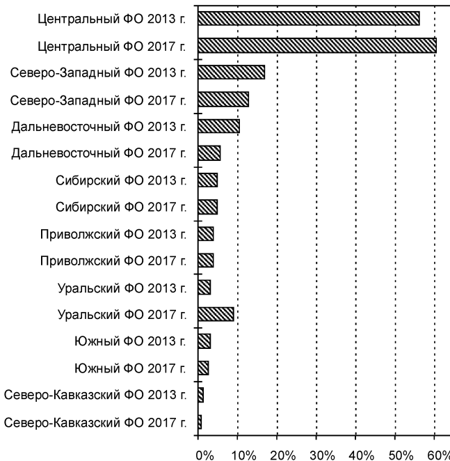
Диаграмма № 3. Построено на основе данных: URL: http://www.customs.ru

В связи с пунктом 3 следует отдельно проанализировать ситуацию в урало-китайском межрегиональном сотрудничестве. С 2013 по 2017 г. объем внешней торговли УрФО с КНР вырос в 1,6 раза.