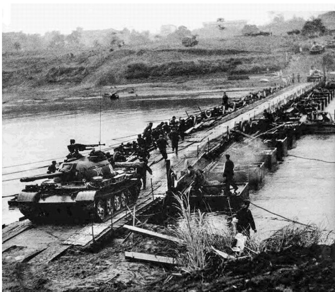
Рис. 3. Китайские войска переходят границу с Вьетнамом.

Основной удар приняли на себя пограничные части и местные вооруженные силы из призванных резервистов. Регулярные части перекрыли дороги на Ханой и Хайфон, до которых оставалось чуть больше сотни километров. Лишь через 10 дней 27 февраля были задействованы части второго корпуса ВНА. А до этого происходила срочная переброска с помощью советских самолётов и кораблей людей и техники с Юга в северные провинции.