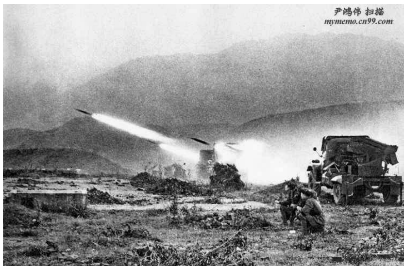
Рис. 5. Вьетнамские «Грады» ведут огонь по китайским позициям.

Вьетнамцы неохотно и не без давления Москвы дали уйти китайским войскам. Там опасались, что Китай развернёт полномасштабную войну против СРВ. Но руководство КНР не решилось дать Вьетнаму «второй урок». В конце апреля начались переговоры. Вьетнам предлагал демилитаризацию границы и установление мирных отношений. Китай требовал в ответ пересмотра отношений с СССР, вывода войск из Кампучии и Лаоса, признания суверенитета КНР