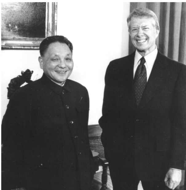
Рис. 2. Дэн Сяопин и президент США Джимми Картер в Вашингтоне.

назвал его «днём второго рождения» Камбоджи после завоевания независимости от Франции 8 . И всё-таки факты говорят, что Вьетнам ввёл свои войска в Камбоджу не из благотворительности и сочувствия к страданиям её народа, а из интересов собственной безопасности и законного желания защитить своих соотечественников в соседней стране. Руководители СРВ действительно хотели создать дружественное государство в Камбодже, дабы положить конец опустошительным набегам в пограничные провинции на юго-западе страны. Но для этого им пришлось ещё более 10 лет держать там свои войска. Ведь «красные кхмеры» при поддержке Китая и Таиланда, при благожелательном «невмешательстве» США и при осуждении Вьетнама со стороны первой пятёрки стран АСЕАН тоже не собирались сдаваться. Благодаря внешней поддержке они сумели перегруппироваться и частично восстановить силы, но на возвращение власти, потеряв доверие населения, они уже не претендовали.