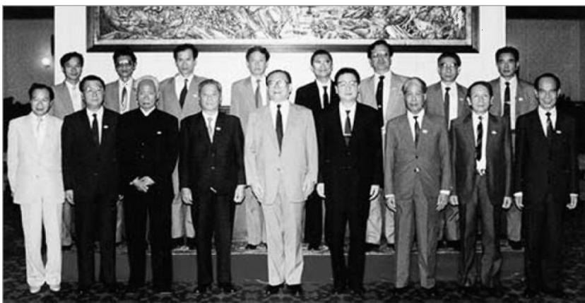
中越领导人成都会晤（1990-9-3）

Рис. 6. Руководители Вьетнам и Китая на саммите в Чэнду. 1990