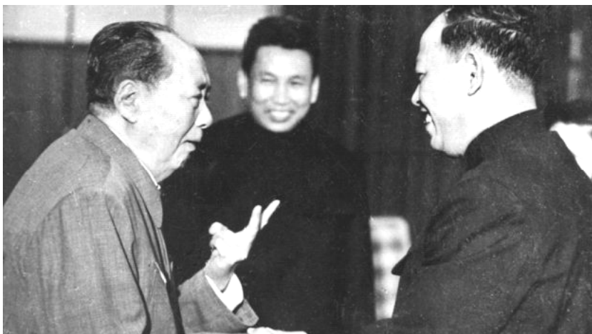
Рис. 1. Мао принимает лидеров «красных кхмеров». Пол Пот в центре, Иенг Сари справа. 1973

Леворадикальная группа Пол Пота—Иенг Сари, поддержанная и направляемая из Пекина, с самого начала заняла враждебную Вьетнаму позицию и выступила с территориальными претензиями к нему. Они были связаны с оставшимися от колониальных времён нерешёнными пограничными вопросами. Режиму Пол Пота был нужен поиск внешнего врага для того, чтобы отвлечь внимание от