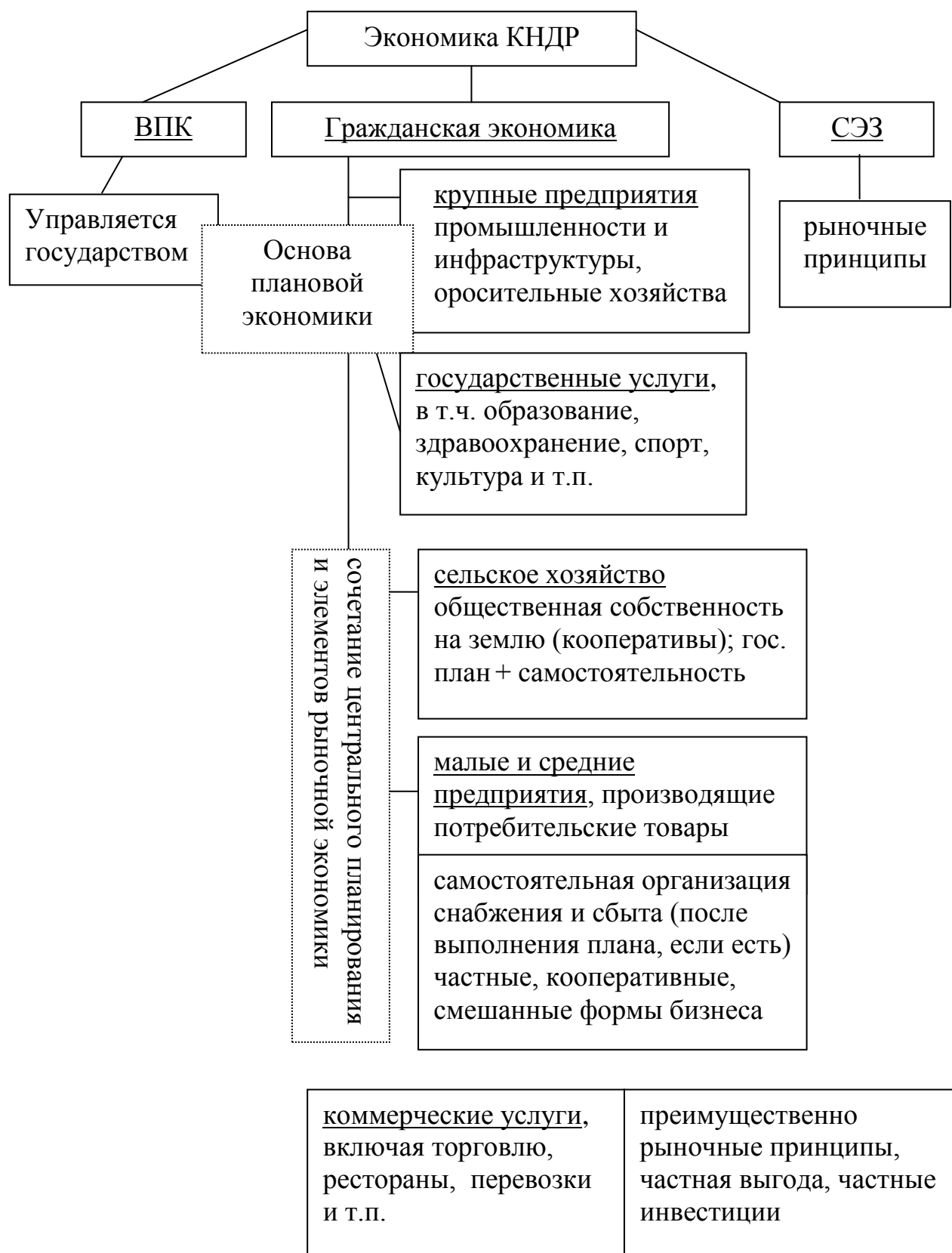
Рисунок 1 - Модель экономики КНДР в 2010-е гг.