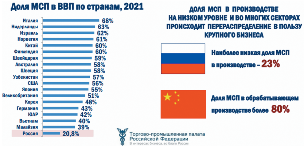
Рис. 2. Доля МСП в России низкая по сравнению с другими странами и неуклонно снижается последние несколько лет

В Китае к МСП относят структуры следующих сегментов (отраслевой стандарт 2011 г.) [15, с. 48]: