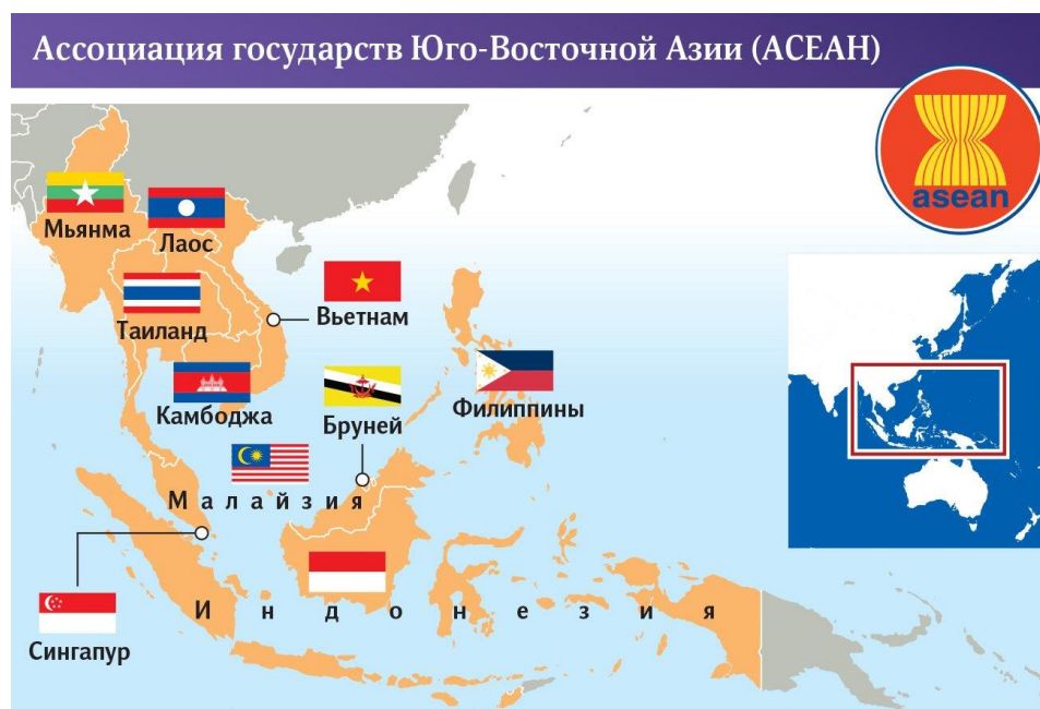
Рис. 1. Государства-члены АСЕАН