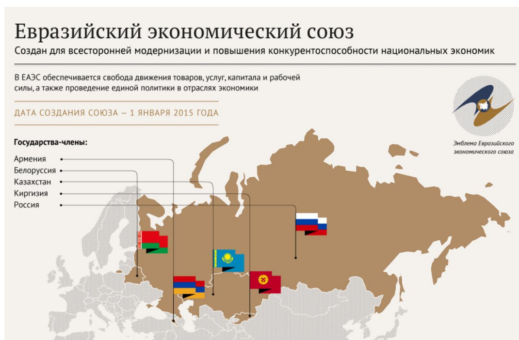
Рис. 2. Государства-члены ЕАЭС