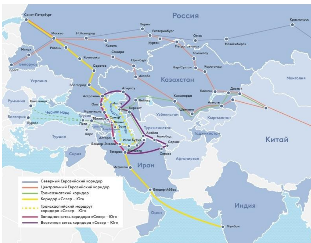
Рис. 4. Международный транспортный коридор «Север-Юг»