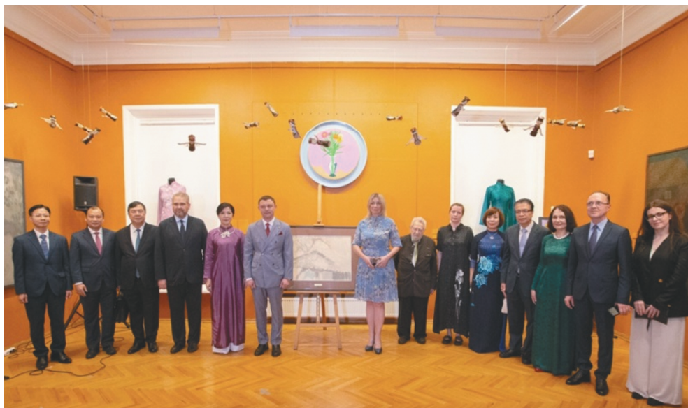
Рис. 1. Открытие выставки в музейно-выставочном комплексе РАХ.