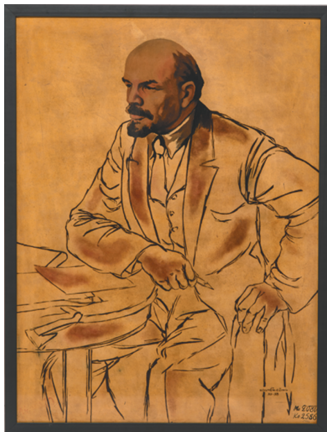
Рис. 9а. Нгуен Конг. Портрет В. И. Ленина. 1958 г.