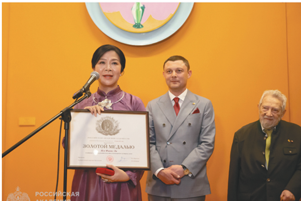
Рис. 2. Президент РАХ В.З. Церетели вручает госпоже Нго Фыонг Ли медаль «Достойному».