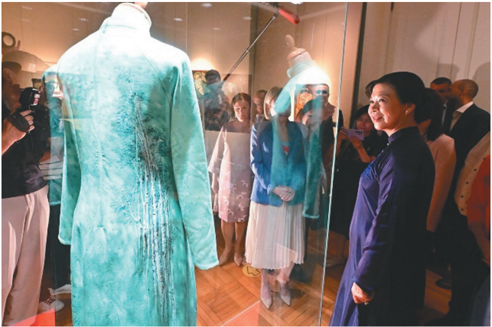
Рис. 3. Супруга Генерального секретаря ЦК КПВ госпожа Нго Фыонг Ли и её аозай.

Собрание Государственного музея Востока обогатилось благодаря г-же Нго Фыонг Ли двумя экспонатами. Супруга То Лама подарила ГМВ традиционное женское платье аозай «с историей»: именно в этом авторском варианте национального женского костюма она прилетала в Москву на празднование 80-летия Победы в мае 2025 г. (рис. 3). По ее словам, решение передать свой аозай в дар ГМВ было продиктовано искренним желанием поделиться красотой вьетнамской культуры с русскими друзьями.