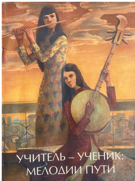
Рис. 6. Фото обложки буклета выставки «Учитель—ученик: мелодии пути»