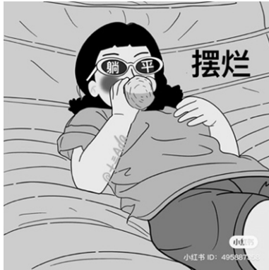
Рис. 1. Пример практики пассивного отношения к стремлениям и вызовам современности

ражает ее влияние на их ценностные ориентации. Данная концепция активно обсуждается в тысячах публикаций, призывая к практике пассивного отношения к стремлениям и вызовам современности (рис. 1).