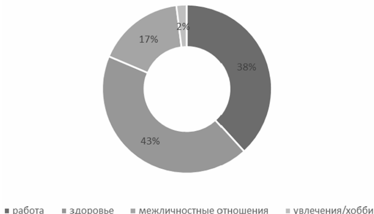
Рис. 2. Оценка степени неудовлетворенности в различных сферах

ется позитивное воздействия на их эмоциональное состояние. Так, 33 % молодых людей считают просмотр интересного фильма важным источником отдыха, 28 % пытаются найти поддержку в соцсетях, что говорит о потребности молодежи в социальных контактах, хобби (как отмечает 22 % опрошенных) является источником самореализации и, как правило, связано со стремлением к самовыражению через отдых и творчество, что очень близко к позиции 17 % респондентов, отметивших попытку создать положительные эмоции через ощущение вкуса и удовольствия от еды (рис. 3);