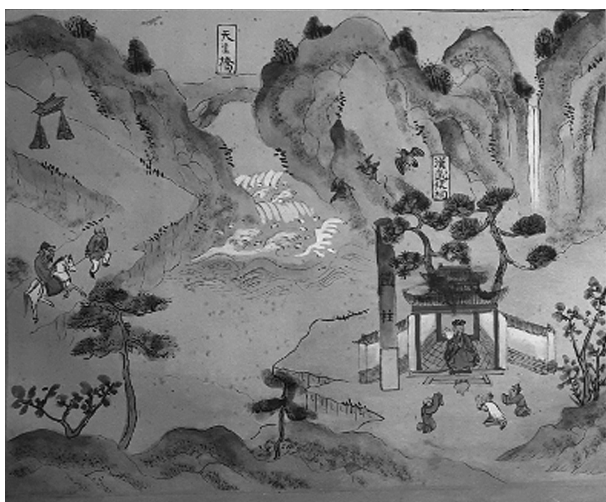
Картина к описанию области Чжао-чжоу с изображением храма Ханьского князя У-хоу (Чжугэ Ляна) 漢武侯祠 и железного столба

и затем отпускал 4 . Так, в начале описания округа Шуньнин-фу (順寧府, № 13) сказано: «Данный округ – это земля варваров пу-ман 浦蠻, с Мэн Ху имеют родство. С тех пор как Чжугэ [Лян] У-хоу арестовал и отпустил его, до Пяти династий и Сун [оставались] все такими же дерзкими, своевольными и глупыми», на карте округа отмечен храм князю У-хоу (Ухоуцы 武侯祠). В описании уезда Илян-сянь (宜良縣, № 29) также упомянуто, что народ гого (в настоящее время называется ицзу) ведет свой род от Мэн Ху. В описании области Чжао-чжоу (趙州, № 14) сказано о роли Чжугэ Ляна в развитии региона: «Во время похода Чжугэ, князя У-хоу, народ восхищался только его походом на Байянь 5 . Добродетель У-хоу в том, что вошел в горные леса и заложил улочки городского поселения... Железный столб в ста ли от управы области. У-хоу захватил Мэн Ху, установил железный столб как память о подвиге, местные часто подносят ему жертвы». Исследование Р. вон Глена упоминает легенду о том, что «Чжугэ Лян и Ма Юань [помогавший ему генерал] обозначили свою победу над народами юга путем возведения бронзовых столбов для обозначения границ ханьских земель, они также устанавливали бронзовые столбы, быков и барабаны над реками завоеванных территорий для умиротворения водных божеств-рептилий, управлявших стратегическими водными переправами» [Glahn von, 1987, p.15]. На карте области Чжао-чжоу изображен храм в честь Ханьского князя У-хоу 漢武侯祠 с желез