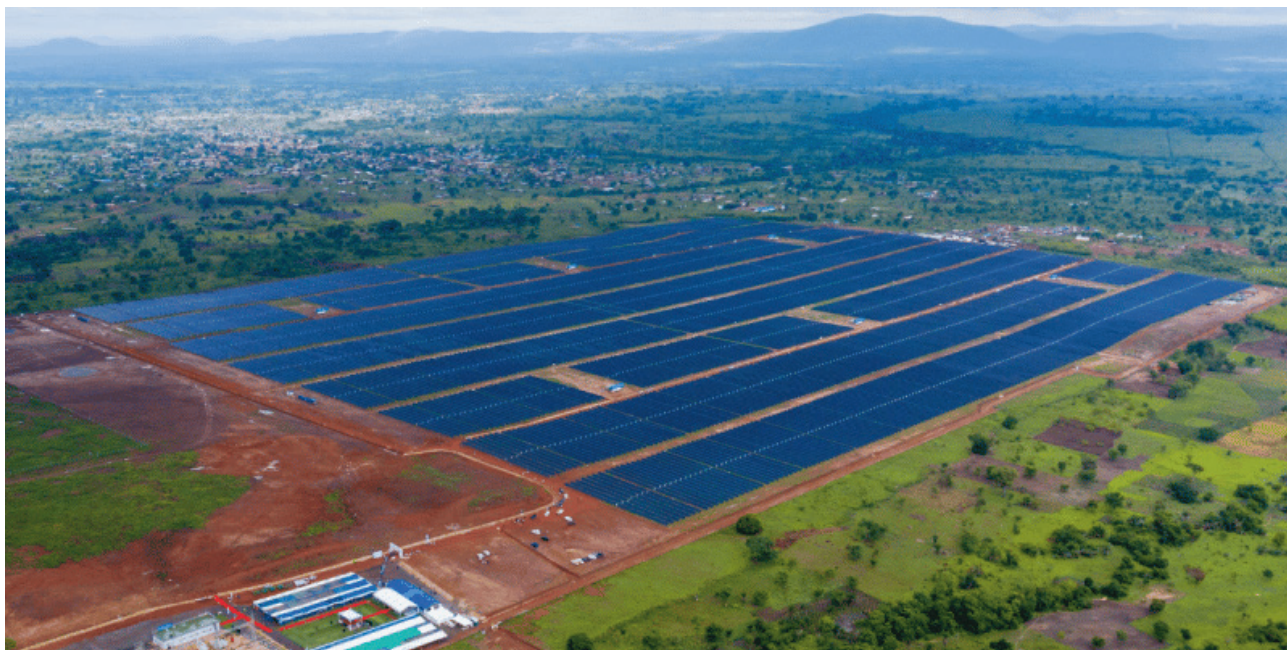
Солнечная фотоэлектрическая электростанция в Того.

Среди главных получателей инвестиций из арабского региона отдельно выделим Египет, на который приходится 80% всех прямых иностранных инвестиций за последнее десятилетие (2012-2022). Далее следуют Марокко, Алжир, Нигерия и ЮАР, на которые в совокупности приходится 15% рынка арабских инвестиций. Понятно, что в этом списке преобладают важные с точки зрения арабских монархий североафриканские арабские союзники.