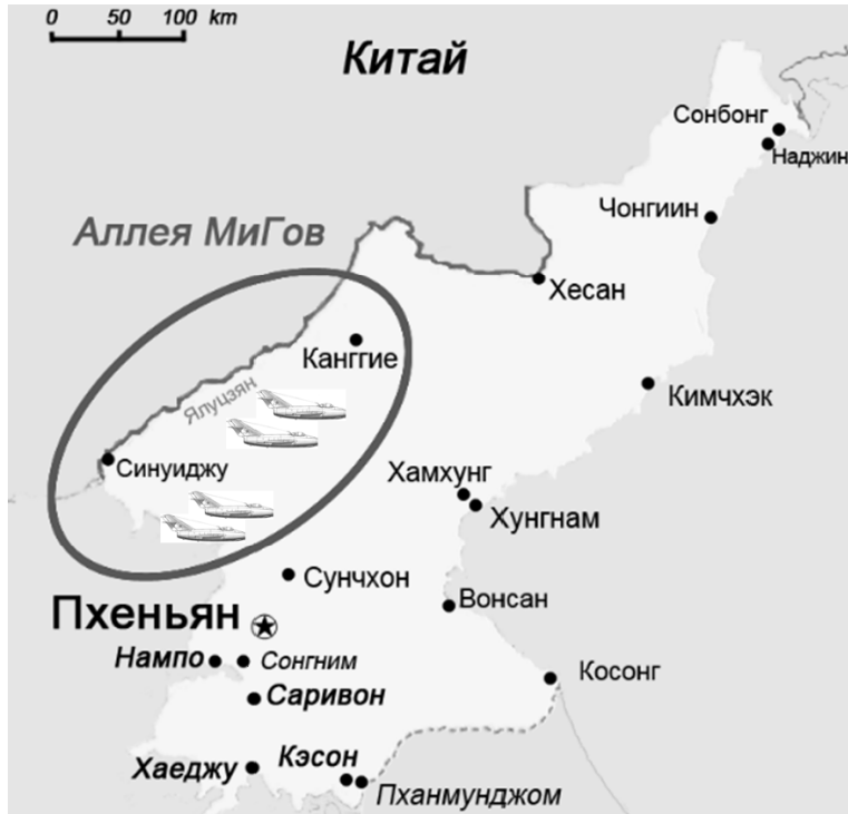
Рис. 1. «Аллея МиГов» в войне в Корее (1950—1953).