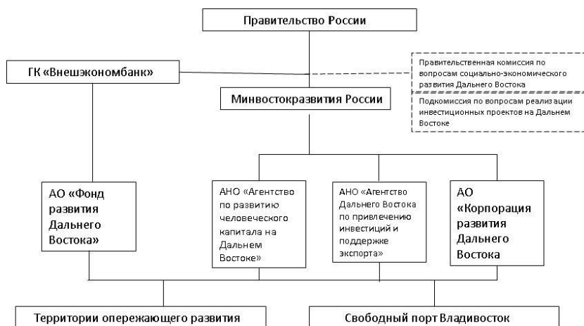
Рис. 1. Система управления развитием Дальнего Востока России. Источники: URL: https://rg.ru/2013/09/19/dv-komissia-site-dok.html ; URL: http://www.minvostokrazvitia.ru/press-center/news_minvostok/?ELEMENT_ID=2839 ; URL: http://www.minvostokrazvitia.ru/press-center/news_minvostok/?ELEMENT_ID=3614 ; URL: http://hcfе.ru/about/general-information/ ; URL: http://erdc.ru ; URL: http://fondvostok.ru/ar2015/about/

го регулирования, и в июле 2015 г. был подписан соответствующий федеральный закон.